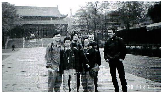
(左から3人目が筆者)