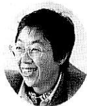
福平先生 編集委員