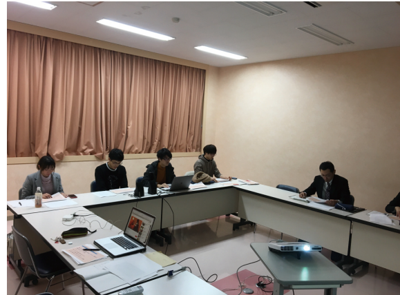
写真2 第1回プレゼンテーション

オリエンテーションから約3週間後、プレゼンテーションを行った（写真2）。約30のアイデアから絞り込まれた10案について事前に内部コンペを行い、最終的に残った5案を北海道警察の担当者に発表した（写真3）。①「実写とグラフィカルなUI」は、白い空間で女子高校生がSNSをしており、その空間に福祉犯罪や詐欺犯罪についての警告文字がモーショングラフィックスとして動き出し、驚くという作品である。②「えっちなおじさん図鑑」は、一人のおじさんが「清楚・20代・小学生」など様々な属性の人物に“擬態”するというアイデアで、「あなたのSNSの友達