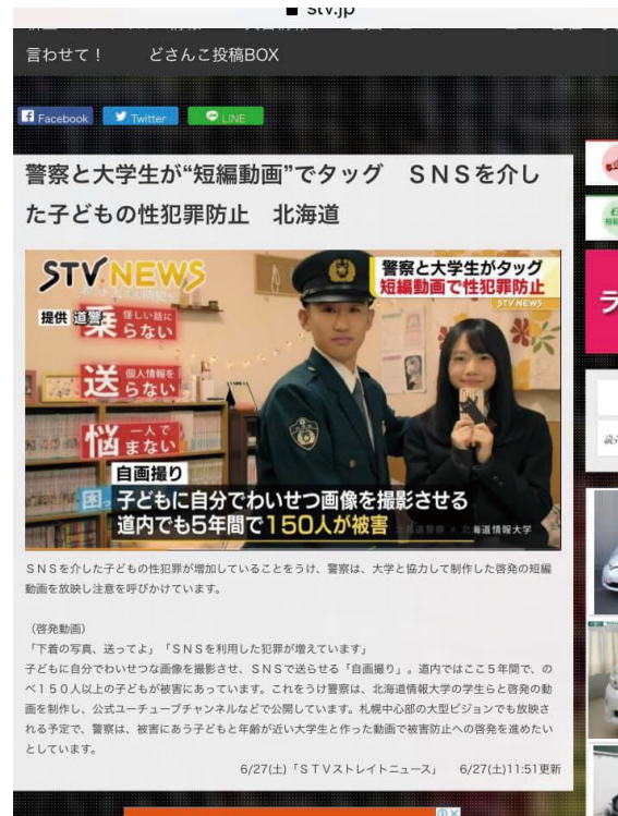
写真14 札幌テレビ放送 (STV) どさんこワイド