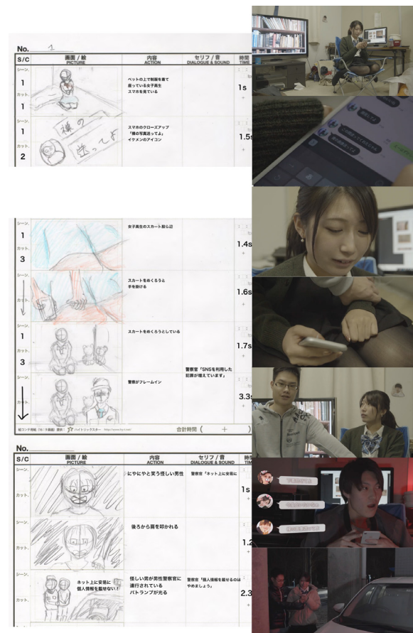
写真7 プレビズ（右）と絵コンテ（左）

に遭いそうになり助けられる危ないシーンについては、演出意図を正しく説明していく必要があつた。募集は知人の紹介やインターネットを使って行い、複数の応募から書類選考を行い、最終的に監督が決定した。結果は現役高校生（撮影当時）の方となり、未成年のキャスティングとなったため、保護者に面会してプロジェクトの背景と演出意図の説明を行った。犯人役と警察官役は北海道警察の現職警察官の方に出演をお願いした。