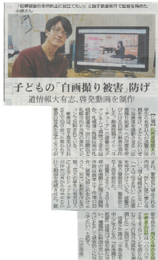
写真15 北海道新聞 (江別版)