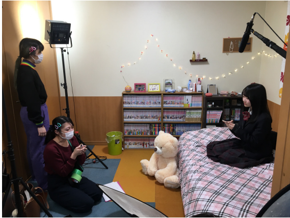
写真8 女子高校生の部屋のセット

の大きい家具であるベッドについてベッドカバーをピンク色とし、カーテンはオレンジ色の入ったものとする事で画面を暖色に設計した(写真8)。登場人物の衣装が紺系の制服であるため背景とのコントラストが出るよ