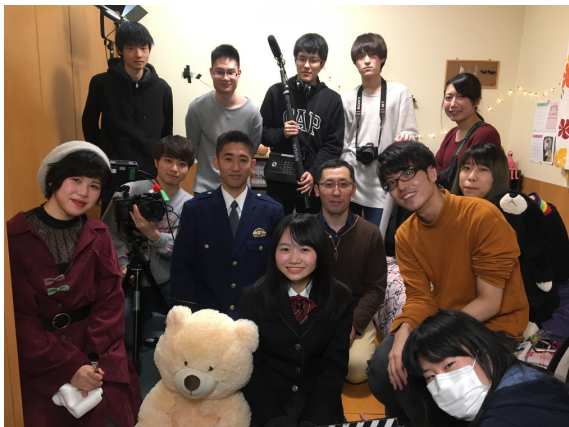
写真10 スタッフ・キャスト集合写真

うになっている。一方、犯人の部屋は閉じこもったサイバー犯罪の感じを出すため青色の背景照明と黒のパソコン画面とし寒色の色彩設計とした(写真9)。演出では、女子高校生が性犯罪に巻き込まれそうな危うい雰囲気撮れるように表情や動作に気をつけた。撮影当日はキャスト3名、スタッフ11名の計14名で行った(写真10)。このうち1名はヘアメイクの担当でビューティーアート専門学校の学生がボランティアで参加してくれた。