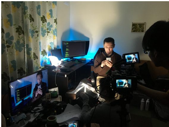
写真9 犯人の部屋のセット