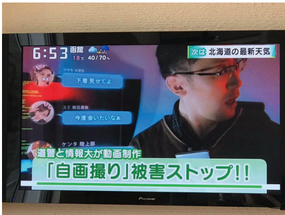
写真13 北海道テレビ (HTB) イチモニ