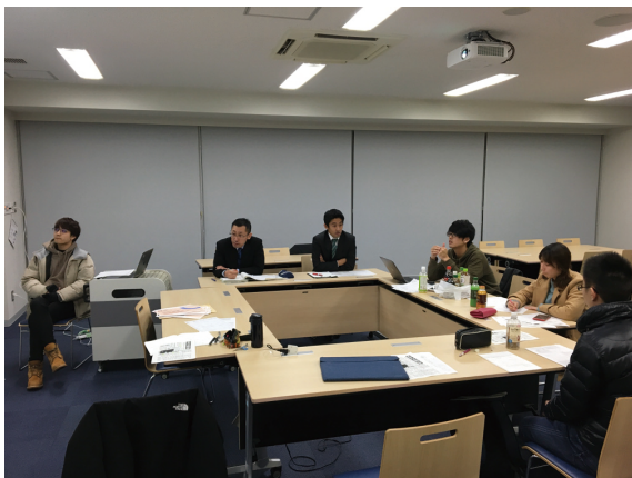
写真4 第2回プレゼンテーション

中から方向性を抽出した。それらは、A. 第三者的な立場から啓発 (①), B. なりすまし (②④), C. 同世代からの注意 (③⑤) の3つである。そして、完成品のアウトプット先が大型ビジョンであることから、できるだけ音声やテキスト情報でなく、極力ビジュアルで伝えられるようにブラッシュアップしていくよう助言した。たとえばCの方向性では同世代から注意を行うが、注意する女子高校生を警察官に置き換えることができれば、視覚で防犯のメッセージを伝えることができる。また映像の終わりに「こうした方がいい、これをしてはいけない」というメッセージがあった方がよいのではないかということも指摘した。たとえば「フィルタリングをかけましょう」「個人情報の投稿はやめましょう」といった終わり方をする事で伝えたいことが明確になる。またこの時点で、作品の長さを15秒にしてはどうかと提案した。デジタルサイネージの放送尺と揃えることで納品物が1つになりポストプロダクション作業(編集)がシンプルになるほか、結果として企画も短くシンプルなものにできる。2回目のプレゼンテーション(写真4)では、技術的な理由からAが後退し、BとCの案が融合するような形で2案に集約されていった。この段階では絵コンテを用意した(写真5, 6)。