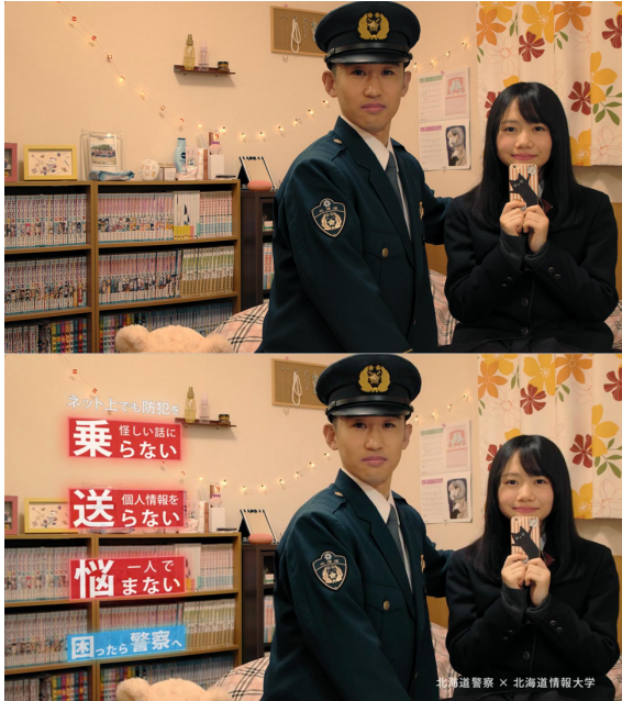
写真12 合成前（上）と合成後（下）

ラストカットはプレビズから変更となり、複数の素材パターンを撮影したが、最終的には画面左に文字を置く構図とした（写真12）。